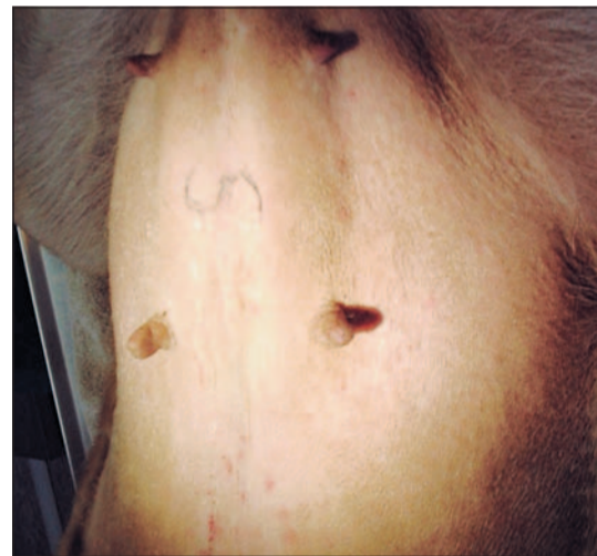
In apertura un momento dell'intervento in cui si è scoperta la presunta sterilizzazione. Sopra, il ventre della cagnolina prima dell'operazione rivelatrice

Ma come? L'asl ha scritto che l'hanno sterilizzata il giorno dopo la cattura e l'ingresso in canile. Eh sì, ma «le ovaie